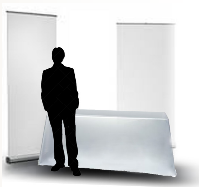
Table Top 4m 2